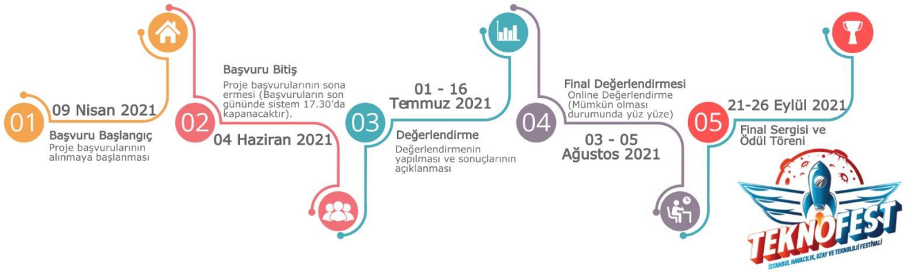
Şekil 3: Yarışma Takvimi

5.1 Yarışma için yılda bir kez başvuru alınır. Birinci aşamayı geçen projeler, alanında uzman bilim insanları tarafından değerlendirilir ve başarılı bulunan projeler Final Yarışmasına davet edilir. Aşağıdaki Şekil 3'de süreç özetlenmiştir.